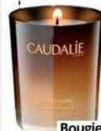
Bougie divine cèdre et vanille, 23,70 €, Caudalie.