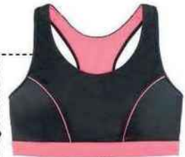
Brassière. Dynamic 3, 14,90 €, Dorina.