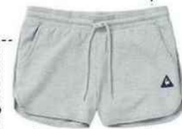
Short. Training confort, 29,40 €, Le Coq Sportif.